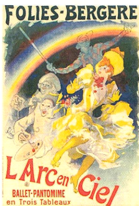
ジュール・シェレ 《「虹」フォーリー・ベルジェール》 1893年