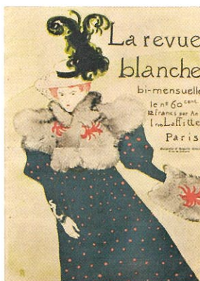
アンリ・ド・トゥールーズ＝ロートレック 《『ラルヴユ・フランシュ』誌》 1895年