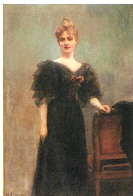
アンリ・ジェルバクス 《金曜日のお》 1900年頃

本展では、大胆な表現力でポスターを芸術の域まで高め、後世に大きな影響を与えた画家・トゥールーズ＝ロートレックを中心に、ミュシャやドガ、デュフィら同時期の画家たちの作品を展覧。ベル・エポックを象徴する女性のファッション、人々の生活、劇場や盛り場など華やかな時代の姿を映し出したパリの芸術を紹介します。