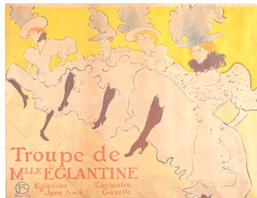
アンリ・ド・トゥールーズ＝ロートレック 《エグランティヌ嬢一座》1896年